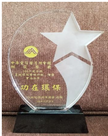
獲頒 「星級環保餐館」