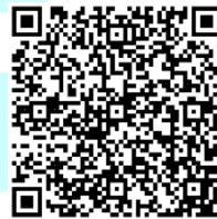
報名連結 QR Code